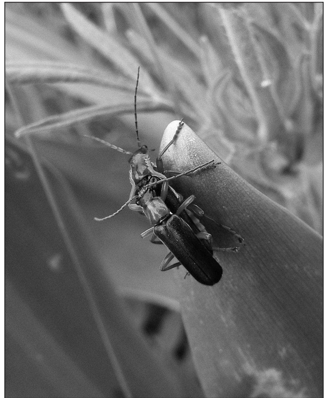
Obr. 2: Páteříčci Cordicantharis longicollis .

Žitková, Hutě Nature Reserve, 48°59'24"N,