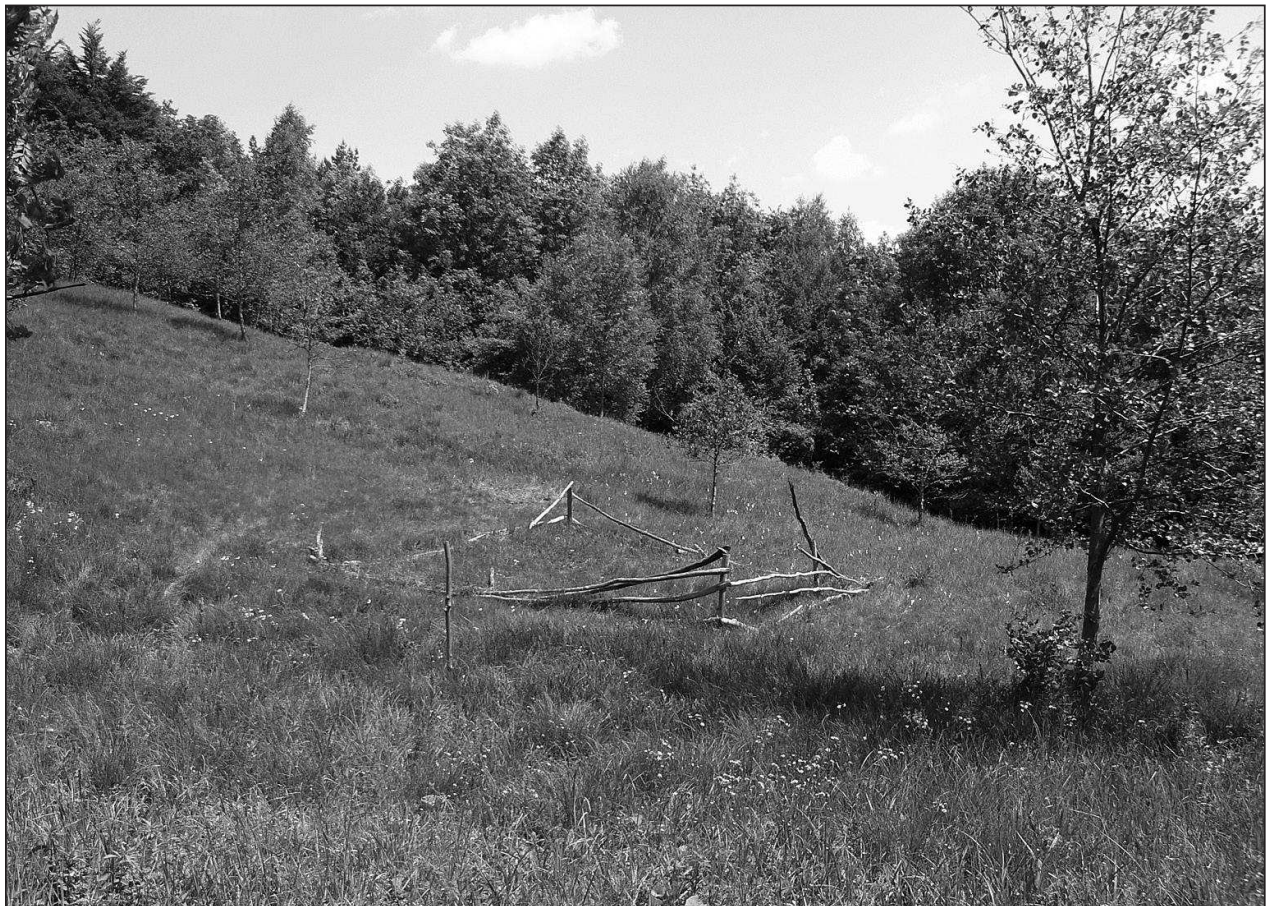
Obr. 3: Svahový mokřad v PP Kalábová u vesnice Březová. Biotop páteříčka Cordicantharis longicollis .

Fig. 2. The soldier beetles Cordicantharis longicollis .